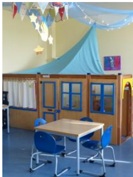
Bild: Räumlichkeiten in unserer OGS