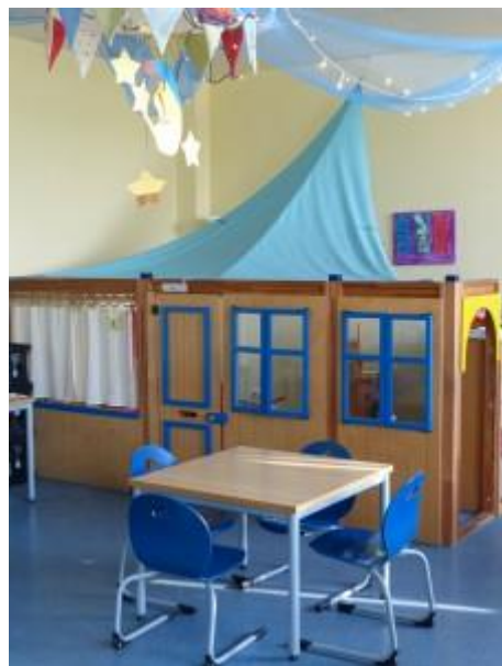
Bild: Räumlichkeiten in unserer OGS