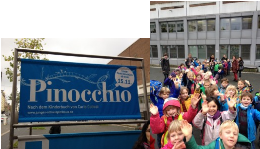
Bild: Kinder auf dem Weg zum Theater

Alle Klassen der Schule haben im ersten Halbjahr das Theaterstück Pinocchio besucht. Das Stück wurde vom Schauspielhaus Düsseldorf aufgeführt. Die Theaterkarten und die Anreise wurden vom Förderverein finanziert.