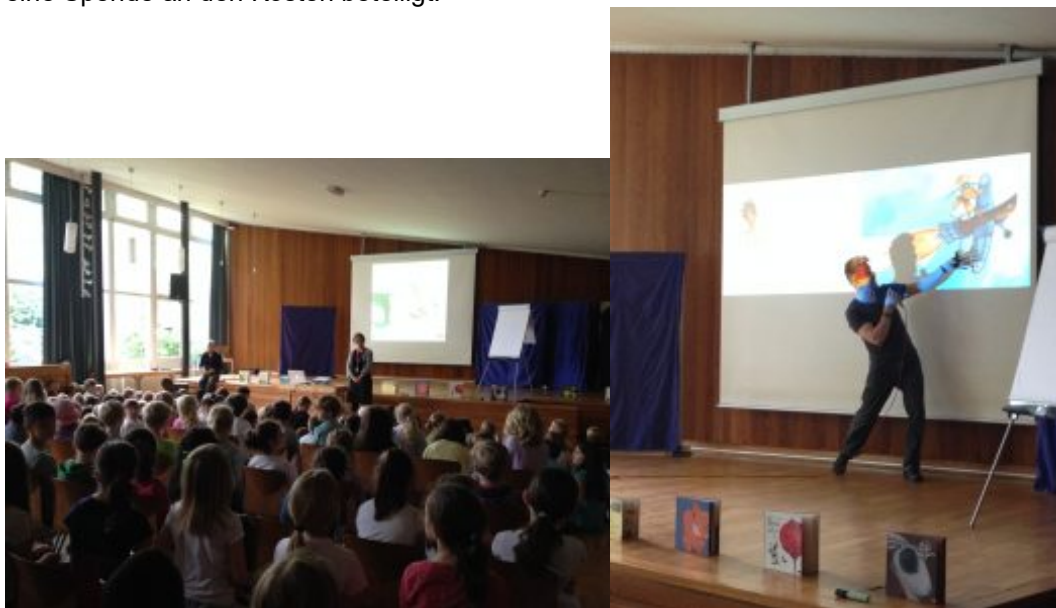
Bild: Lesung in der Aula