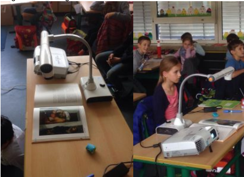
Bild: Dokumentenkamera im Unterricht

Der Förderverein hat Mittel zu Anschaffung von zwei Dokumentenkameras bereitgestellt. Damit kann der Unterricht sinnvoll ergänzt werden. Die Stadtparkasse hat sich durch eine Spende an den Anschaffungskosten beteiligt.