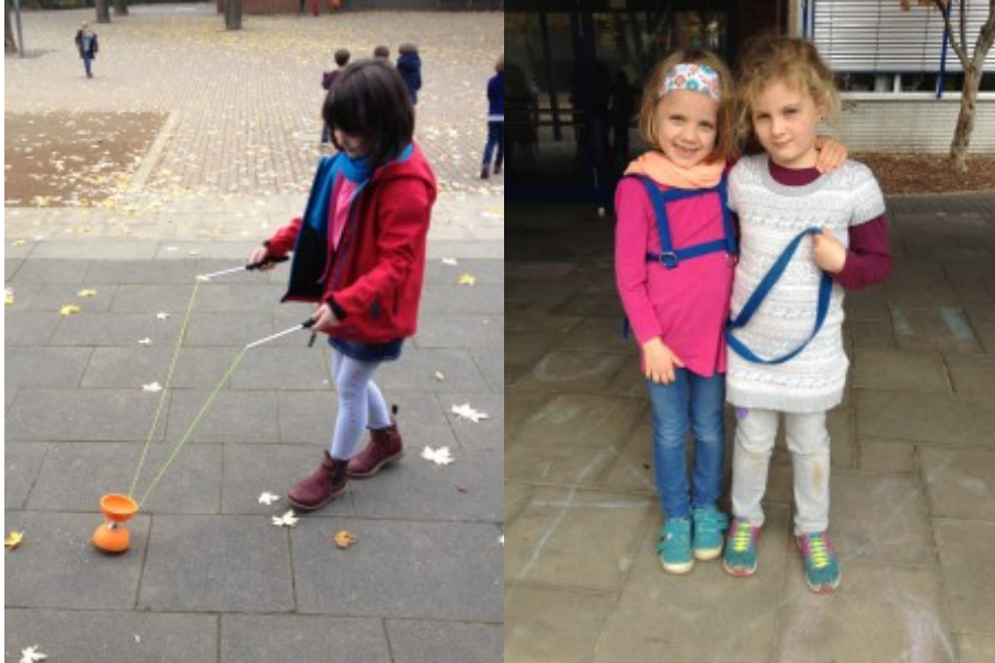
Bild: Kinder mit Pausenspielzeug

Von dem Geld wurden zum Beispiel Bälle, Tischtennisschläger und –bälle, Springseile, etc. angeschafft.