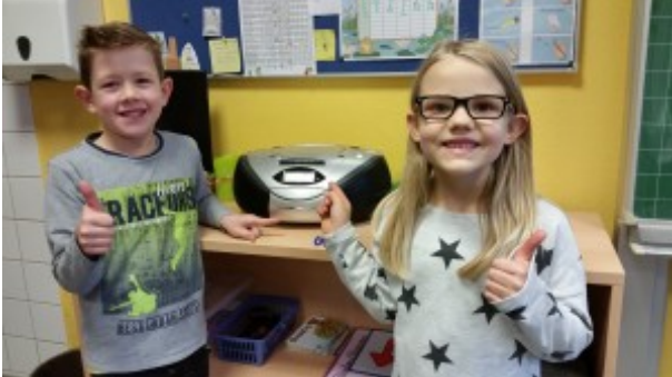
Bild: Kinder mit neuem CD-Player

Der Förderverein hat Mittel zu Beschaffung für sieben CD-Player bereitgestellt. Der Einsatz erfolgt z. B. in den Unterrichtsfächern Englisch, Musik und Deutsch.